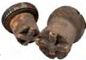
Twee kurken met een kruisje erin uitgesneden voor gebruik op Aswoensdag, ca. 1900-1910, ABM v158a-b

Bijna alle godsdiensten kennen een periode waarin minder gegeten wordt. Zo bereiden gelovigen zich voor op een groot feest. Het minder of helemaal niet eten noemen we vasten.