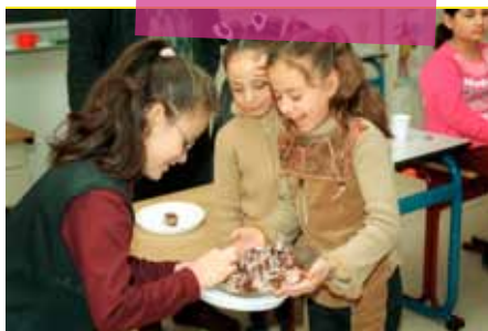
Kinderen van de islamitische basisschool Abu Daoed vieren het Suikerfeest