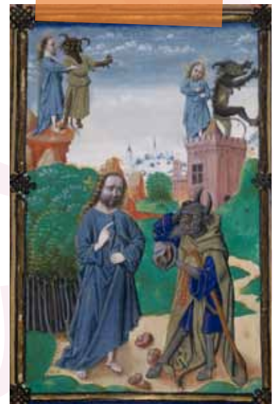
De duivel daagt Jezus uit om de stenen te veranderen in brood (Matteüs 4), Delft, 1487, OKM h3, f. 46v

De vastentijd duurt veertig dagen omdat Jezus zelf evenveel dagen door de woestijn zwierf zonder eten. Die vastendagen zijn verspreid over zes en een halve week: op zondagen tussen Aswoensdag en Pasen hoeft niet gevast te worden.