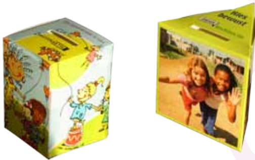
Spaardoosjes Vastenactie en Kerk in Actie

Het is een serieuze periode: gelovigen staan stil bij het feit dat Jezus veel geleden heeft. Ze denken ook aan mensen die altijd weinig te eten hebben. Ze zamelen daarom geld in. Tegenwoordig vasten christenen niet meer zo streng.