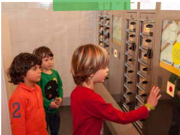
Kom naar Feest! Weet wat je viert en doe het Fast Feast Foodspel

Wat eet jij het liefst op je verjaardag? Patat of pannenkoeken? Bij feest hoort lekker eten. Vaak hoort een gerecht ook speciaal bij een feest zoals eieren bij Pasen. Ook in andere religies is dit zo. De mensen eten speciaal voedsel omdat het hen aan God of aan hun geloofsovertuiging herinnert.