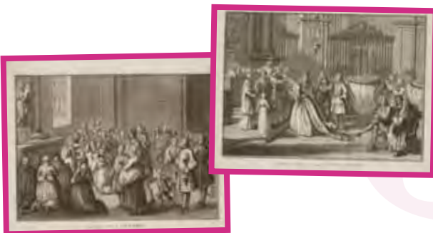
Ceremonie van aswoensdag en gezegend brood, B. Picart, 1724, ABM g556.13